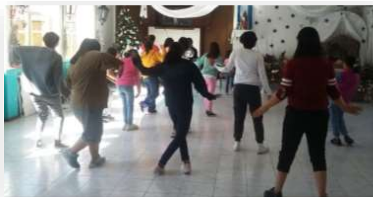
Las niñas en clase de zumba.